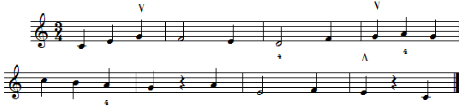
شكل رقم (١٦) يوضح تمرين مستوحى من الجزء الثاني من مقطوعة رقم (٢٥) من كتاب سوزوكي THE Little Sevcik