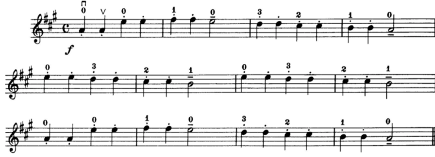
شكل رقم (١) يوضح مقطوعة تونكيل Twinkle من كتاب سوزوكي "Suzuk Violin Method-Vol 01"

- يتم عزف سلم لا الكبير والأربيج بالشكل التالي :