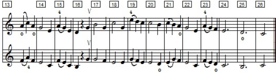
شكل رقم (١٥) يوضح الجزء الثاني من مقطوعة رقم ٢٥ من كتاب سوزوكي THE Little Sevcik