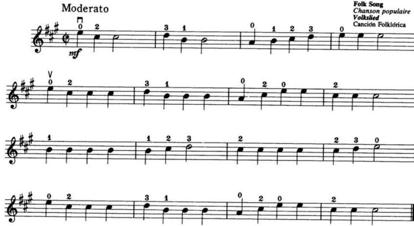
شكل رقم (٨) يوضح دراسة الجزء الثاني من مقطوعة Song of the Wind من كتاب سوزوكي "Suzuk Violin Method-Vol 01"

- يستمع الطلاب الى الجزء الثاني من مقطوعة Song of the Wind من كتاب سوزوكي "Suzuk Violin Method-Vol 01".