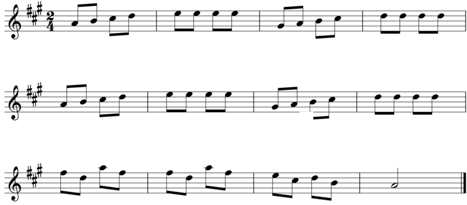
شكل رقم (٧) يوضح تدريب مستوحي من الجزء الأول من مقطوعة "Song of the Wind" من كتاب سوزوكي "Suzuk Violin Method-Vol 01"