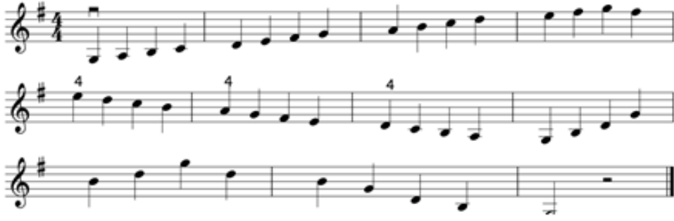
شكل رقم (١٨) يوضح سلم صول الكبير ٢ اوكتاف والاربيج

- يتم عزف سلم صول الكبير وأربيجيه بالشكل التالي :